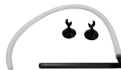
シャワーパイプセット